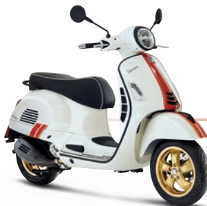
Weiß Racing Sixties BR