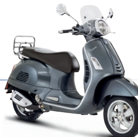
Grau Travolgente G03