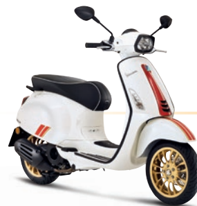
Weiß Racing Sixties BR