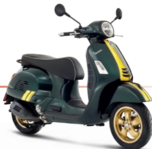
Grün Racing Sixties VY