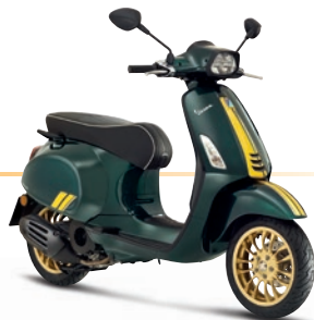
Grün Racing Sixties VY